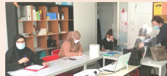
Tous nos ateliers respectent les règles sanitaires en vigueur

Différentes actions sont proposées pour construire ce projet et lever des freins.