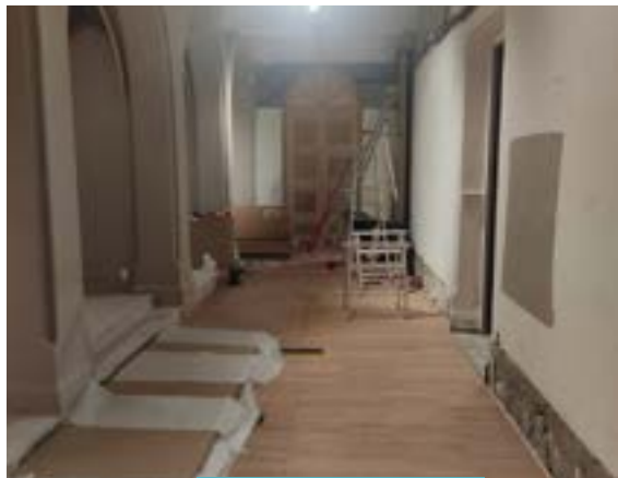
Travaux de menuiserie

Les travaux du musée avancent en vue de sa réouverture le 20 avril prochain. Le musée pourra accueillir concomitamment l'exposition permanente qui, grâce aux œuvres de notre collection permettra aux visiteurs d'appréhender la dévotion mariale et l'histoire du sanctuaire depuis la chapelle médiévale jusqu'à l'édification de la basilique actuelle. L'ancienne chapelle, dont les décors sont conservés, recevra les expositions temporaires.