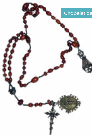
Chapelet de Clément VIII

Le chapelet en argent et aux grains en ambre peut être daté de la fin du XVI e siècle. L'acquisition a été motivée par le fait que ce chapelet classique est enrichi par deux médailles dont l'une représente Notre-Dame de Fourvière selon l'iconographie de la fin du XVI e siècle. L'autre médaille, uni face, montre une Crucifixion rayonnante placée sous un dais ; sur l'autre face, un morceau de vélin découpé aux dimensions de la médaille porte les mots tracés à l'encre violette : chapelet donné à Clément VIII par les chapelains (sic) de Fourvières en souvenir du Traité de Lyon en 1601. Le chapelet fut conservé par lui jusqu'à sa mort en 1605.