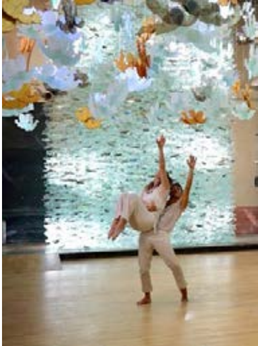
Danse contemporaine dans le musée à l'occasion des journées du patrimoine

Ces journées sont inscrites dans le calendrier culturel et connaissent un succès toujours renouvelé ; cette année elles ont permis d'accueillir 3 000 visiteurs, émerveillés devant l'exposition Marcoville, Lumières Célestes . Elles permettent à un public de plus en plus large et curieux de découvrir des œuvres variées et porteuses de sens.