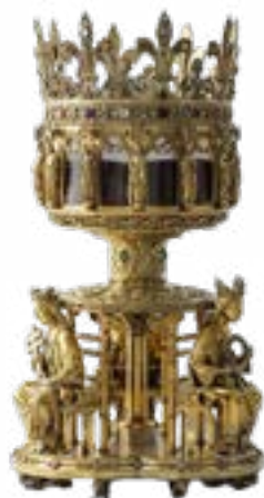
Reliquaire de la Sainte Couronne d'Épines 1862, Trésor de Notre-Dame de Paris Musée du Louvre, Guillaume Benoit

Le 11 décembre et le 15 février 2024, nous avons découvert la nouvelle exposition du musée des Beaux-Arts de Lyon Les formes de la ruine , qui propose un dialogue entre les civilisations grâce à la présentation de différentes approches de la notion de ruine et des traditions pluriséculaires d'Orient et d'Occident.