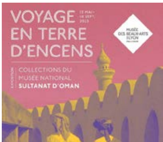
Affiche de l'exposition

Parallèlement à plusieurs visites commentées de l'exposition Marcoville Lumières Célestes , nous avons découvert l'exposition Voyage en terre d'encens. Collections du Musée national - Sultanat d'Oman au musée des Beaux-Arts . Célébré pour la beauté de ses paysages (sublimés par les photographies de Ferrante Ferranti, grand ami de l'Association et du musée), le Sultanat d'Oman est fort d'un passé millénaire et de traditions longuement préservées. Au travers d'une vingtaine d'œuvres, de l'Antiquité à nos jours, cette exposition-dossier a permis de découvrir un patrimoine à la fois historique et artistique témoignant de la richesse de la culture omanaise.