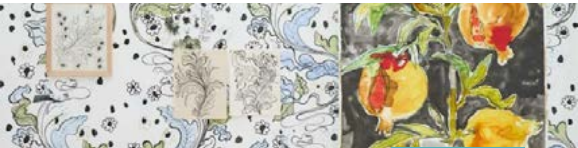
Affiche de l'exposition