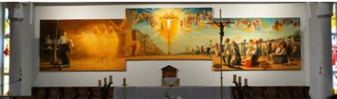
Retable de la Sainte Trinité, église éponyme

Samedi 16 mars, 14h30 – Eglise de la Sainte-Trinité.