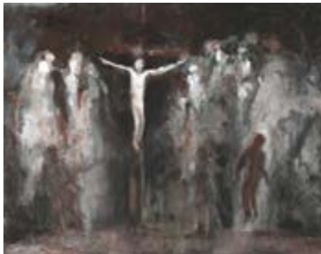
Face à Face

L'exposition de Fourvière reprend celle du Collège des Bernardins Stat Crux qui se déroule du 27 février au 6 avril 2024, enrichie d'autres œuvres. Son intitulé est inspiré de la devise des Chartreux « Stat Crux dum volvitur orbis » (La Croix demeure tandis que le monde change).