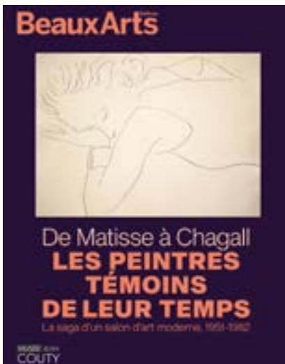
Affiche de l'exposition