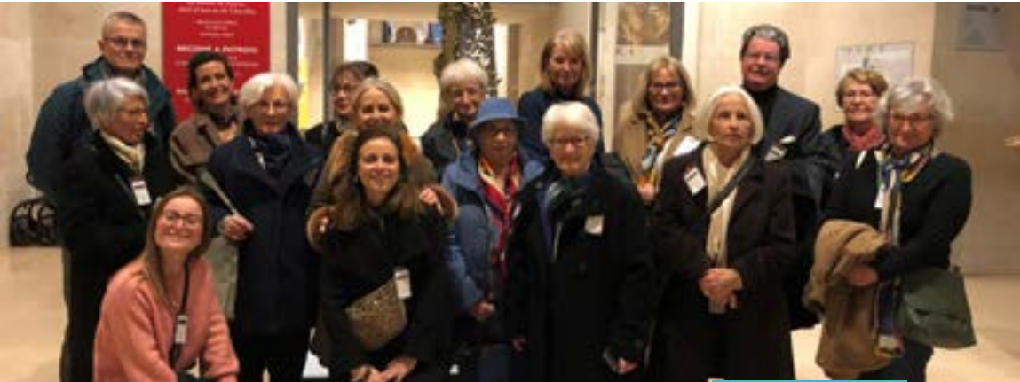
Les Amis au Louvre

Le 5 décembre, nous avons profité d'une très belle journée à Paris : le matin, à l' Hôtel de la Marine , magnifiquement restauré, visite des appartements de l'Intendant du Garde-Meubles de la Couronne (le Mobilier national aujourd'hui), des salons d'apparat et de la loggia. Et l'après-midi, jour de fermeture du musée du Louvre , nous avons pu découvrir l'exposition Le Trésor de Notre-Dame de Paris, des origines à Viollet-le-Duc , présentée dans la galerie Richelieu de ce musée.