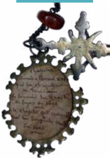
Chapelet de Clément VIII

Cette pièce historique intéresse l'histoire de notre Ville. En effet, le Traité de Lyon auquel il est fait référence, a permis de clore le conflit opposant la France d'Henri IV et le duché de Savoie dont le souverain, Charles Emmanuel I er , avait cherché à étendre son territoire aux dépens de la France après l'assassinat d'Henri III ; la vallée du Rhône et Lyon étaient menacés. En représailles, Henri IV envahit les vallées de Maurienne et de Tarentaise. Le négociateur principal du traité n'est autre que Pietro cardinal Aldobrandini, neveu du pape Clément et le traité est conclu un mois après la première rencontre du roi Henri avec son épouse Marie de Médicis ; le mariage avait été célébré par procuration au Dôme de Florence par le même cardinal Aldobrandini. Sans doute, les chapelains du sanctuaire de Fourvière qui avait essuyé, quelques trente ans plus tôt, les assauts du baron des Adrets ont-ils été heureux d'échapper à une nouvelle dévastation et font ce présent au pontife romain par l'intermédiaire de son neveu. Ainsi ce modeste chapelet rend compte d'une belle page de l'histoire de France.