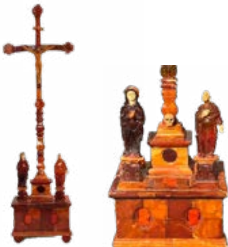
Chapelle domestique, calvaire et chandeliers. Ambre et ivoire, Europe du Nord, début XVII e