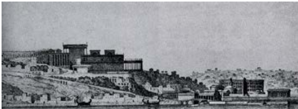
La colline de Fourvière dans l'Antiquité