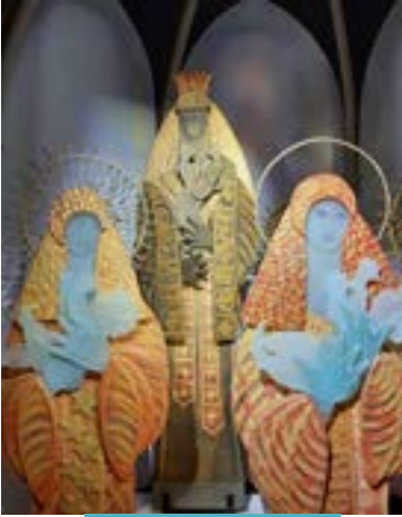
Vierges à l'enfant