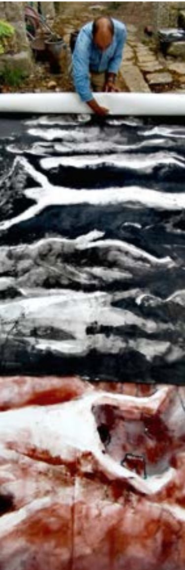
FX de Boissoudy au travail