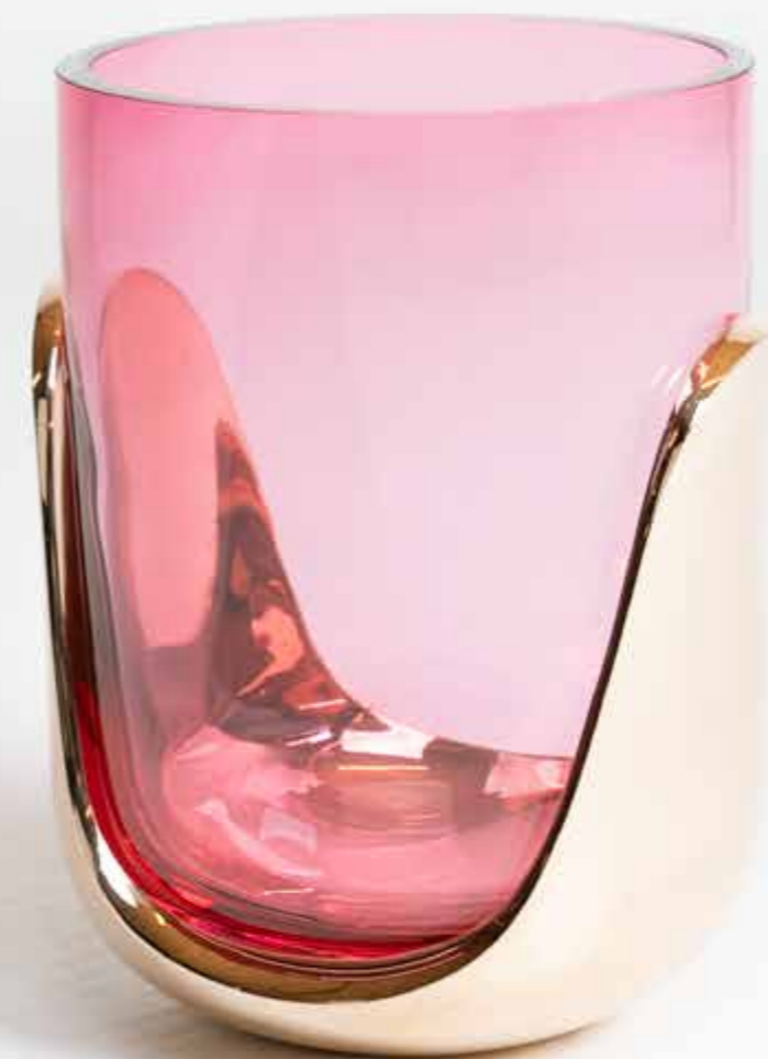
43. Eric Schmitt (né en 1955) Vase - Modèle 'Hill' Bronze doré poli et verre soufflé de Bohême Édition Studio Eric Schmitt Monogrammé 'E.S' sous la base en bronze Modèle créé en 2006 H 33,5 x Ø 24 cm 3 500 / 4 500 €