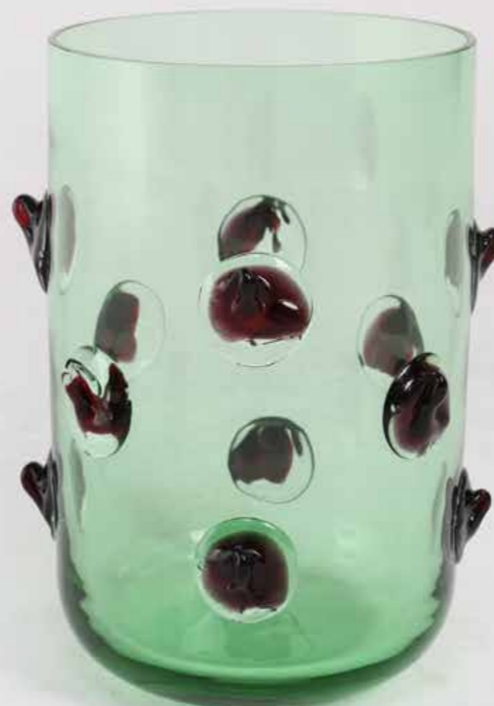
23. Eric Schmitt (né en 1955) Vase - Modèle 'Bobème' Verre soufflé de Bohême Édition Studio Eric Schmitt Monogrammé 'E.S' sous la base Modèle créé en 2006 H 38 x Ø 24 cm 2500 / 3500 €