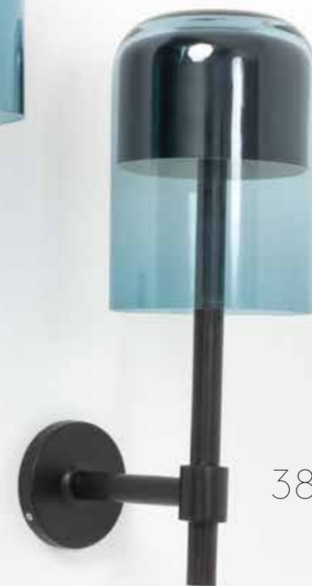
38. Eric Schmitt (né en 1955) Applique - Modèle 'Hat' Bronze patiné et verre soufflé de Bohême Édition Studio Eric Schmitt Monogrammée 'E.S.' Modèle créé en 2023 H 61 x L 22,5 x P 34,5 cm 5 000 / 7 000 €