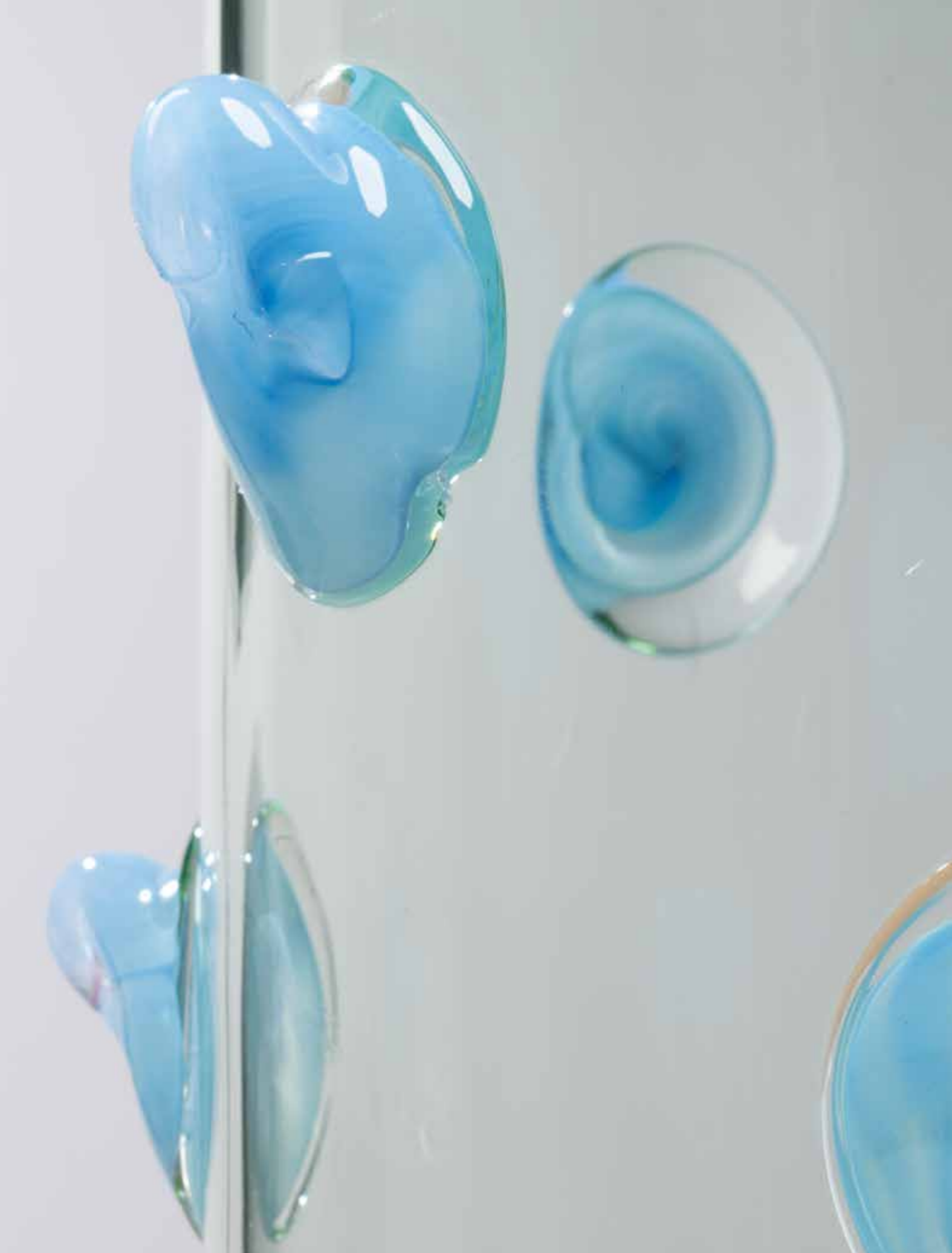
24. Eric Schmitt (né en 1955) Vase - Modèle 'Bohème' Verre soufflé de Bohême Édition Studio Eric Schmitt Monogrammé 'E.S.' sous la base Modèle créé en 2006 H 37,5 x Ø 28 cm 2500 / 3500 €