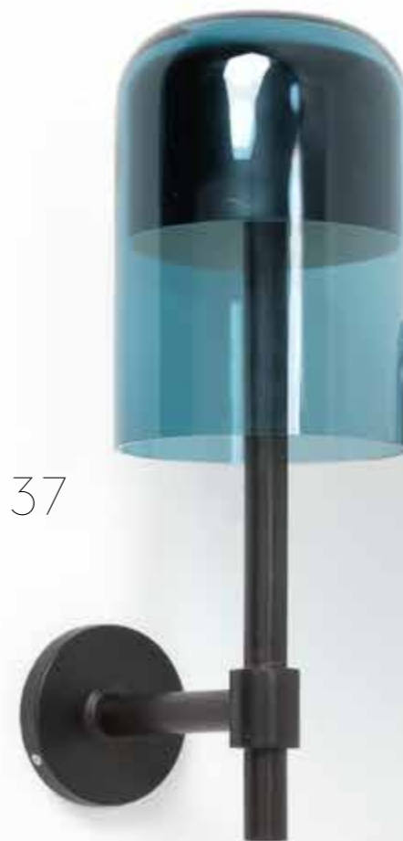
37. Eric Schmitt (né en 1955) Applique - Modèle 'Hat' Bronze patiné et verre soufflé de Bohême Édition Studio Eric Schmitt Monogrammée 'E.S.' Modèle créé en 2023 H 61 x L 22,5 x P 34,5 cm 5 000 / 7 000 €