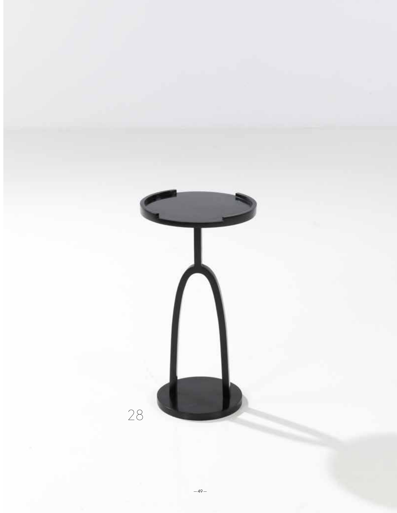
28. Eric Schmitt (né en 1955) Table d'appoint - Modèle 'Mercues' Bronze patiné Édition Studio Eric Schmitt Monogrammée 'E.S.' sur la base Modèle créé en 1999 H 56,5 × Ø 30 cm 5000 / 7000 €