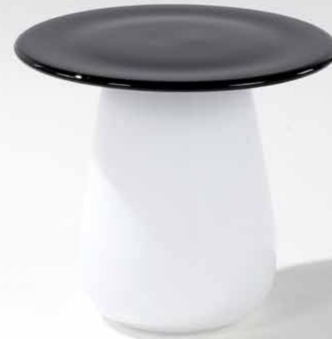
14. Eric Schmitt (né en 1955) Table d'appoint - Modèle 'Champignon' Édition limitée Verre soufflé de Bohême Édition Studio Eric Schmitt Monogrammée 'E.S.' sous la base Modèle créé en 2011 H 42 × Ø 47 cm 2500 / 3500 €