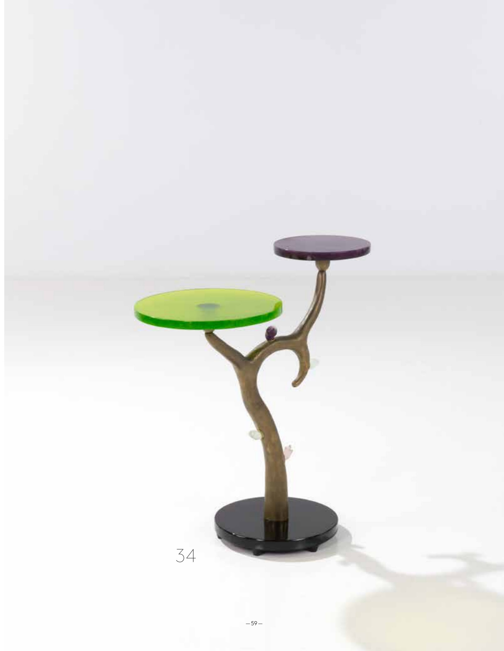
34. Eric Schmitt (né en 1955) Table d'appoint - Modèle 'Possi' Crystal, pâte de verre et bronze à patine dorée Édition Studio Eric Schmitt en collaboration avec Daum Monogrammée 'E.S' et signée 'Daum France' sur la base Modèle créé en 1990 H 74 x L 68,5 x P 35 cm 5000 / 7000 €