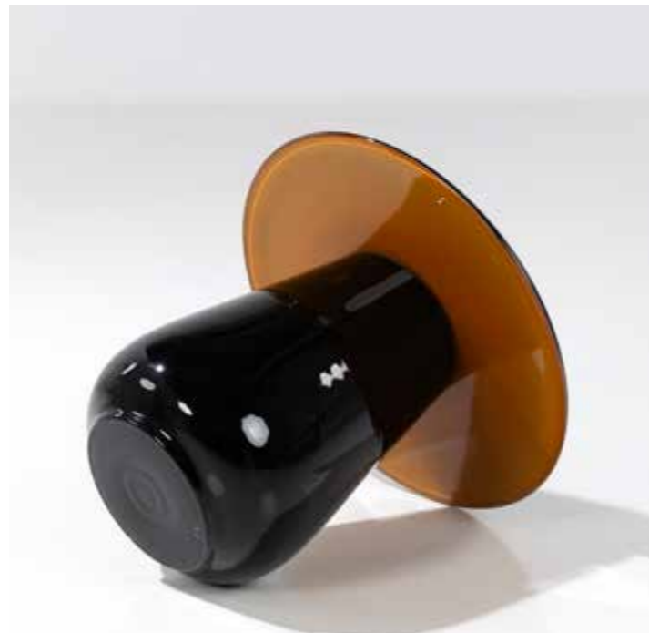
13. Eric Schmitt (né en 1955) Table d'appoint - Modèle 'Champignon' Édition limitée Verre soufflé de Bohême Édition Studio Eric Schmitt Monogrammée 'E.S.' sous la base Modèle créé en 2011 H 42,5 × Ø 51 cm 2500 / 3500 €