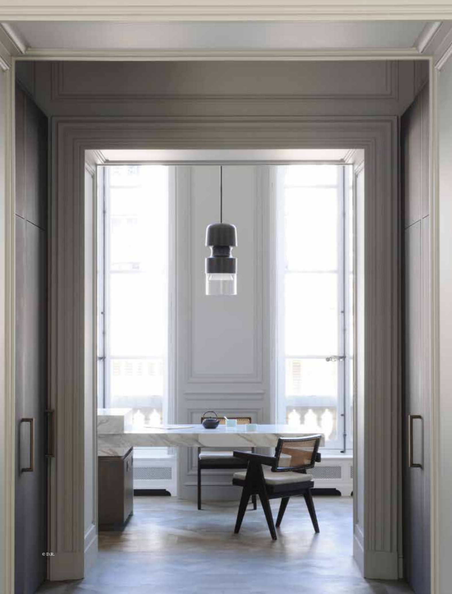
15. Eric Schmitt (né en 1955) Suspension - Modèle 'Fingi' Épreuve d'artiste 4/4 Bronze patiné et verre soufflé de Bohême Édition Studio Eric Schmitt, limitée à 8 exemplaires + 4 E.A. Monogrammée 'E.S' et numérotée 'EA 4/4' Modèle créé en 2000 H (totale) 163 x Ø 30 cm 12 000 / 18 000 €