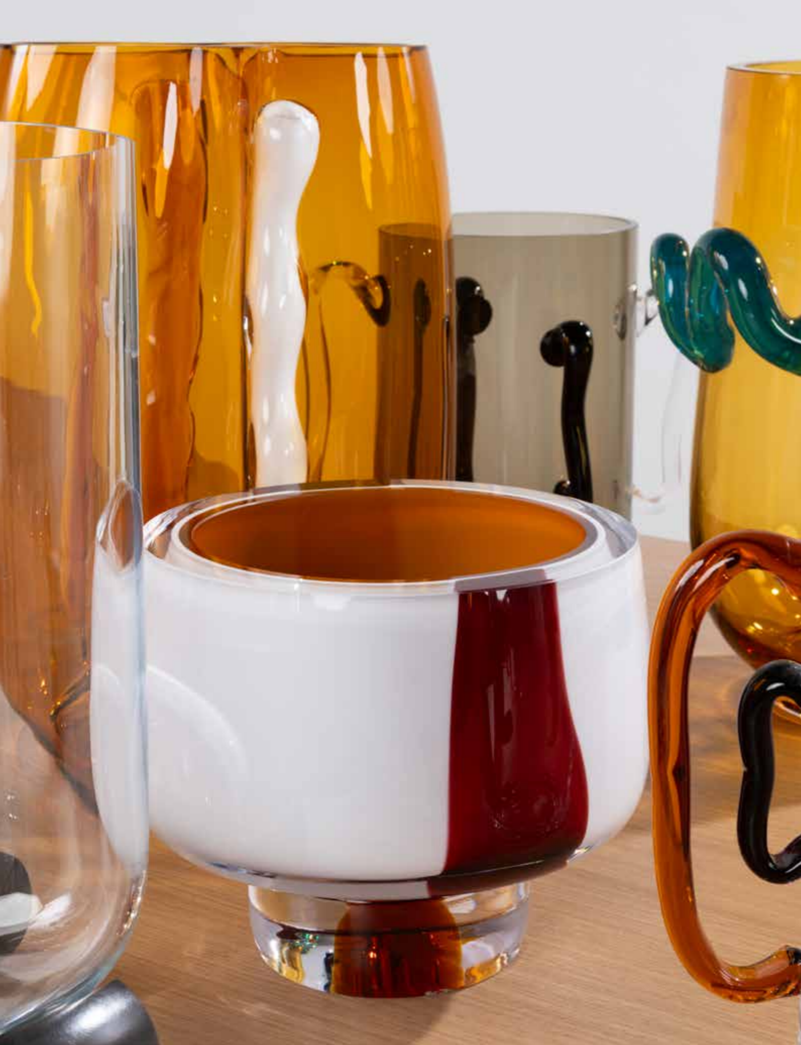
53. Eric Schmitt (né en 1955) Vide poche - Modèle ' Coupelle ' Verre soufflé de Bohême Édition Studio Eric Schmitt Monogrammé 'E.S.' sous la base Modèle créé en 2016 H 19 × Ø 22 cm 1000 / 1500 €