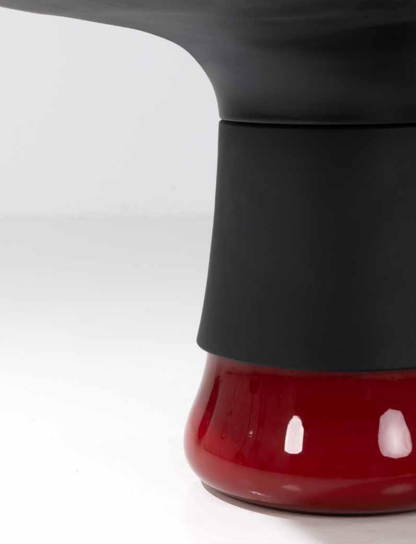
11. Eric Schmitt (né en 1955) Table haute - Modèle ' Bulb ' Épreuve d'artiste 3/4 Aluminium anodisé teinté et verre soufflé de Bohême Édition Ralph Pucci International, limitée à 24 exemplaires + 4 E.A. Monogrammée 'E.S.' et numérotée 'EA 3' Modèle créé en 2011 H 75 x Ø 130,5 cm 14 000 / 18 000 €