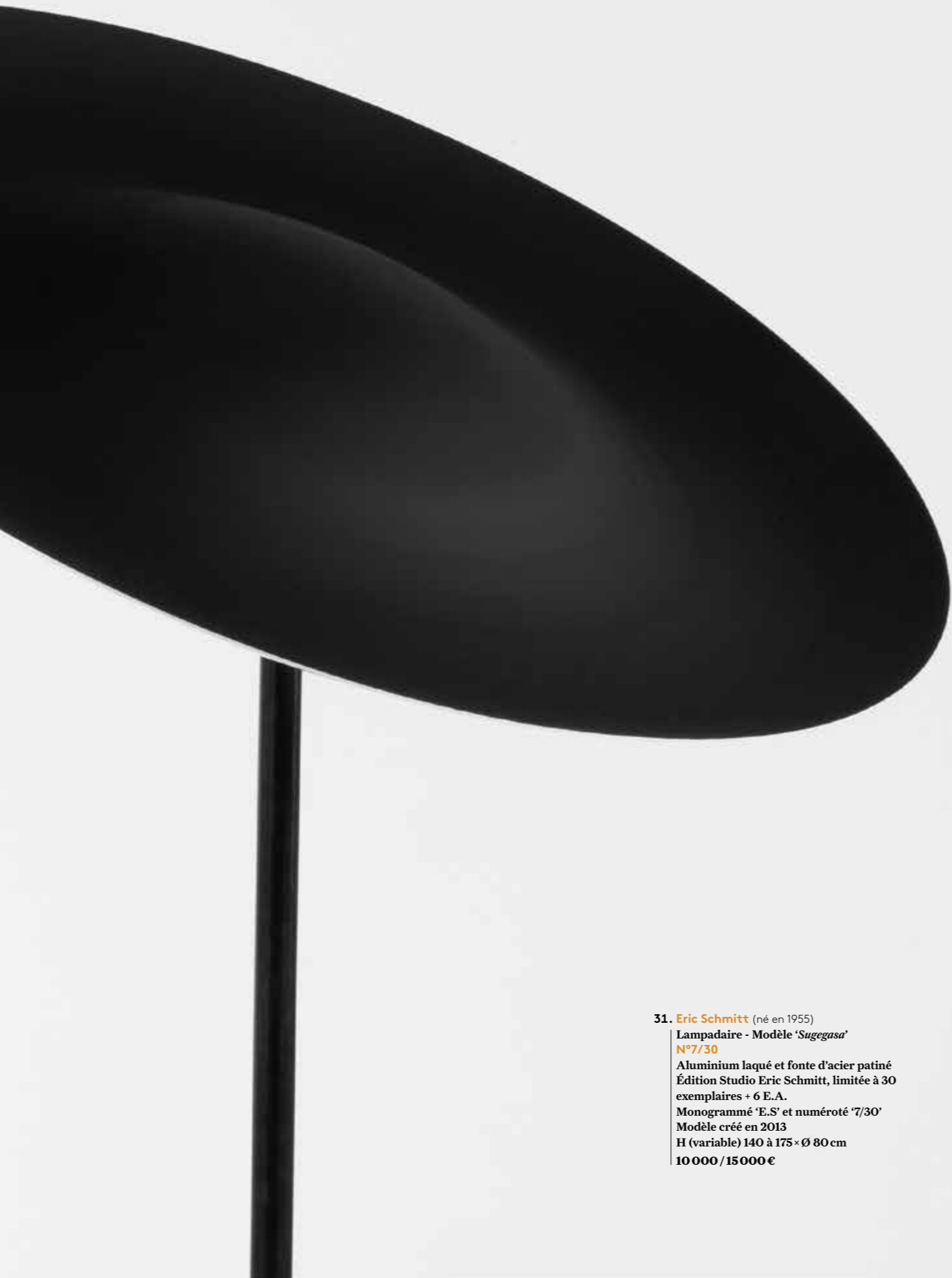
31. Eric Schmitt (né en 1955) Lampadaire - Modèle ' Sugegasa ' N°7/30 Aluminium laqué et fonte d'acier patiné Édition Studio Eric Schmitt, limitée à 30 exemplaires + 6 E.A. Monogrammé 'E.S' et numéroté '7/30' Modèle créé en 2013 H (variable) 140 à 175 × Ø 80 cm 10 000 / 15 000 €