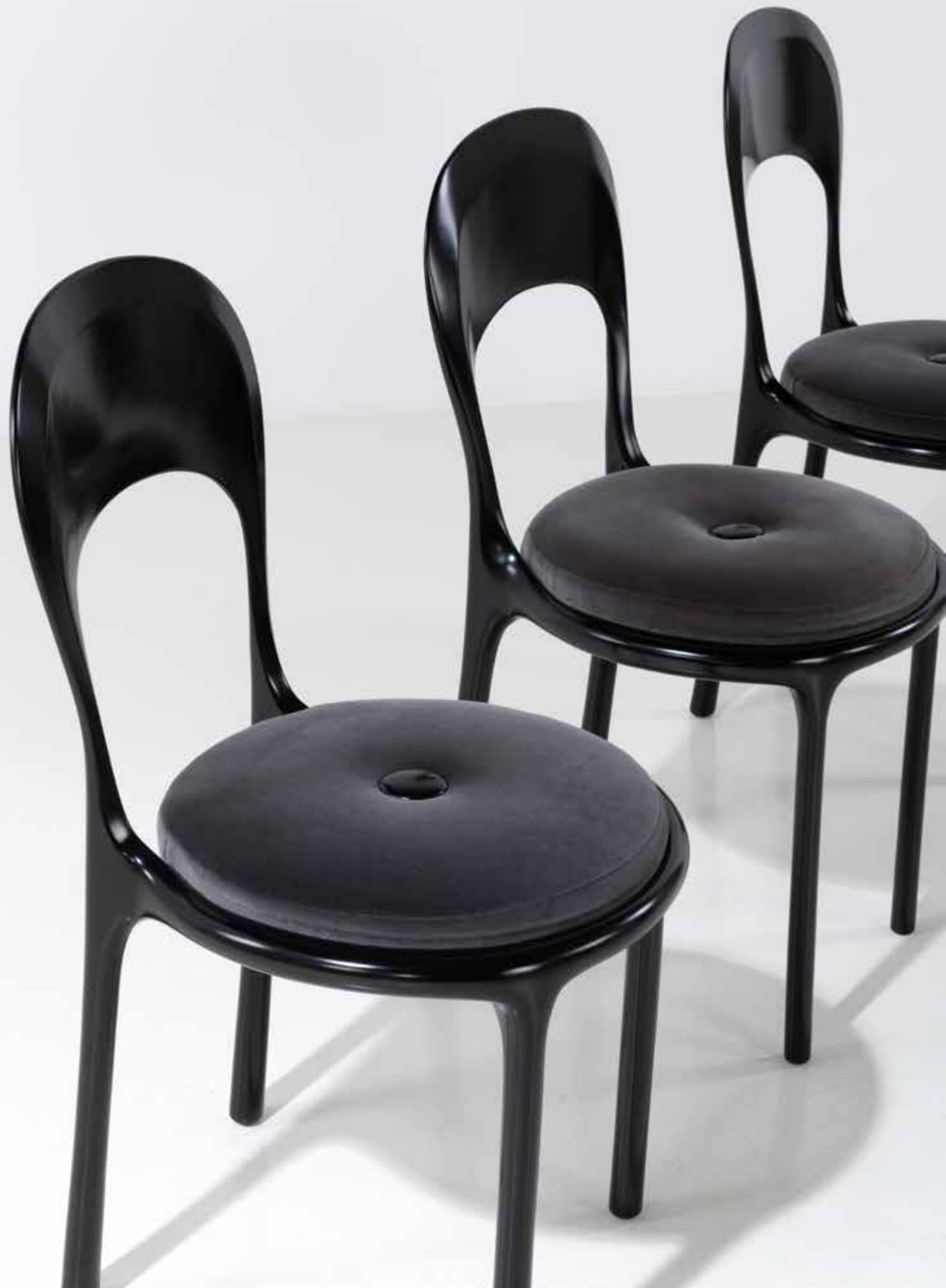
48. Eric Schmitt (né en 1955) Suite de quatre chaises - Modèle 'Chairie I' Hêtre laqué et velours Édition Studio Eric Schmitt Monogrammées 'E.S.' et numérotées Modèle créé en 2017 H 87,5 x L 47 x P 49 cm 10 000 / 15 000 €