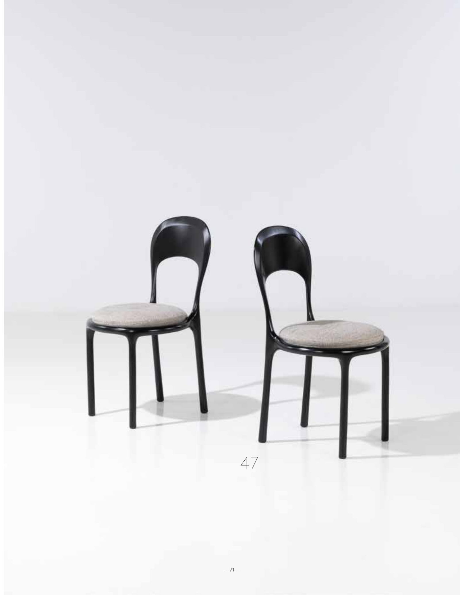
47. Eric Schmitt (né en 1955) Paire de chaises - Modèle 'Chairie I' Hêtre laqué et textile Édition Studio Eric Schmitt Monogrammées 'E.S' et numérotées Modèle créé en 2017 H 87,5 x L 47 x P 49 cm 5000 / 7000 €