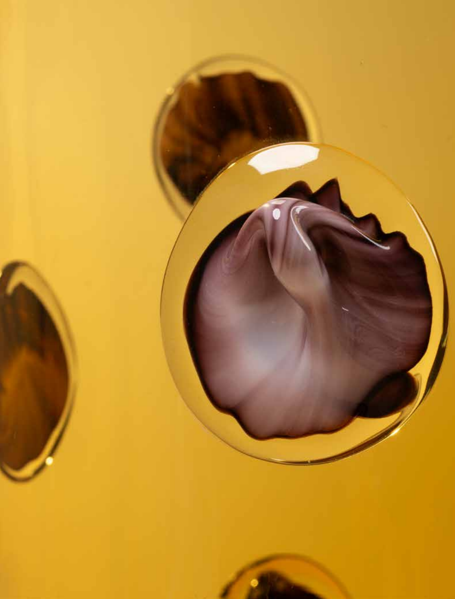
21. Eric Schmitt (né en 1955) Vase - Modèle 'Bohème' Verre soufflé de Bohême Édition Studio Eric Schmitt Monogrammé 'E.S.' sous la base Modèle créé en 2006 H 37,5 x Ø 27 cm 2500 / 3500 €