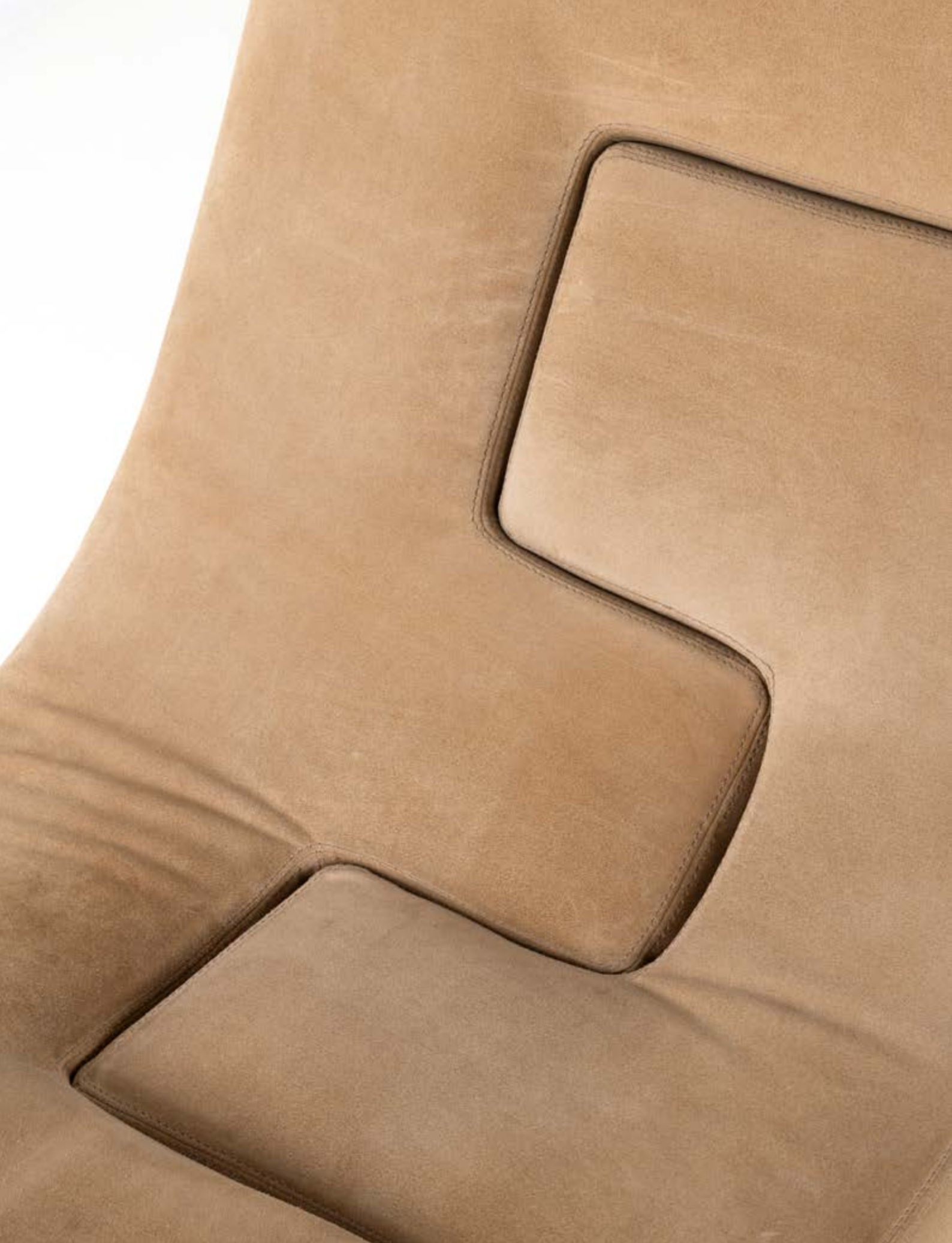
11. Charles Tassin (né en 1959) & Maylis Tassin (née en 1970) Chauffeuse - Modèle 'Tess and Ottoman' Velours Édition May Modèle créé en 2017 H 88 × L 62 × P 100 cm 3 000 / 4 000 €