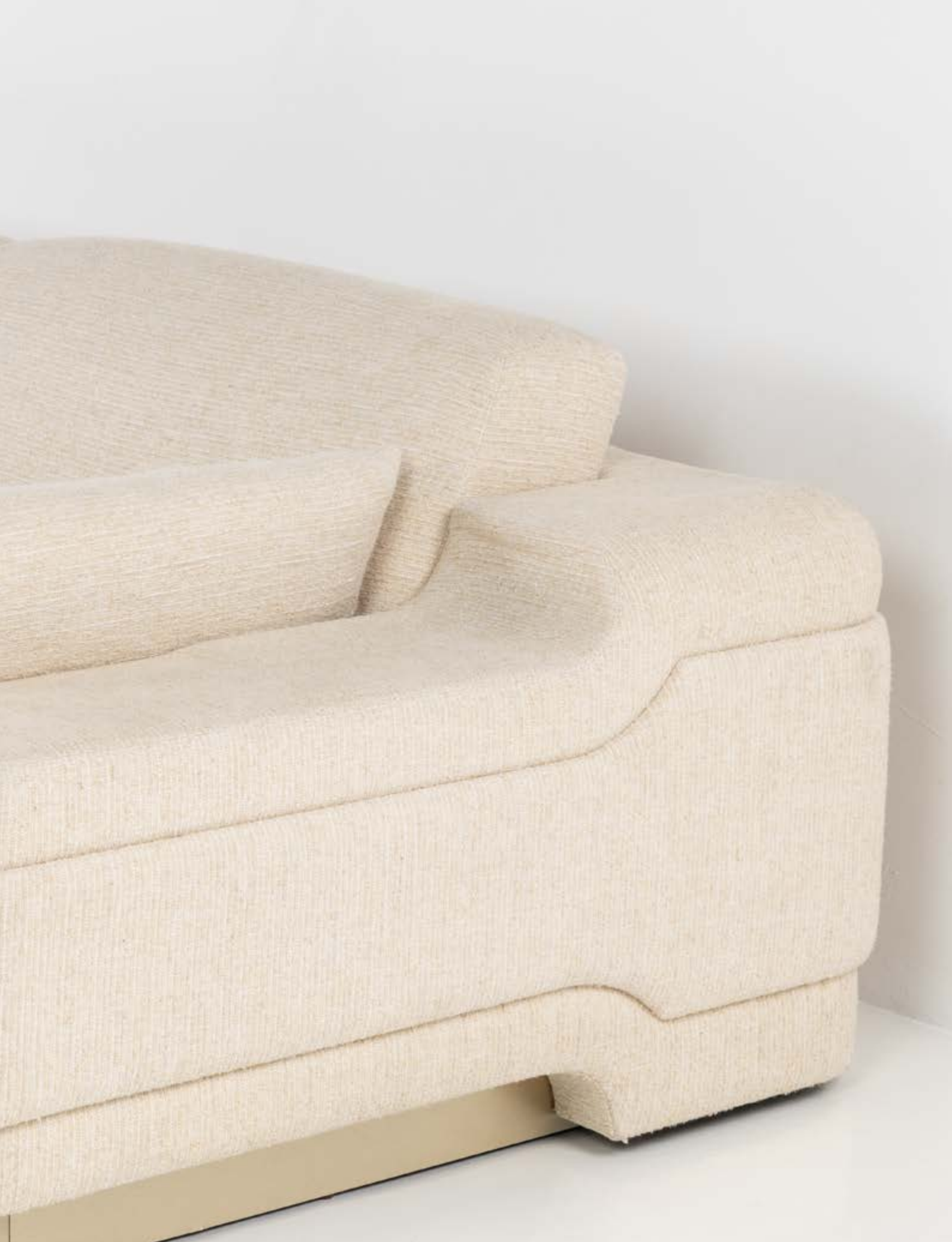
03. Charles Tassin (né en 1959) & Maylis Tassin (née en 1970) Canapé - Modèle 'Martt' Bois peint et textile Édition May Modèle créé vers 2017 H 85 × L 263 × P 117 cm 4 000 / 6 000 €