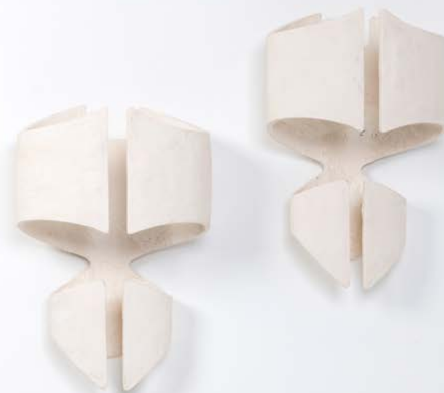
17. Charles Tassin (né en 1959) & Maylis Tassin (née en 1970) Paire d'appliques - Modèle 'Batt' Plâtre et acier Édition May Modèle créé en 2020 H 61 × L 40,5 × P 20 cm 1 500 / 2 000 €