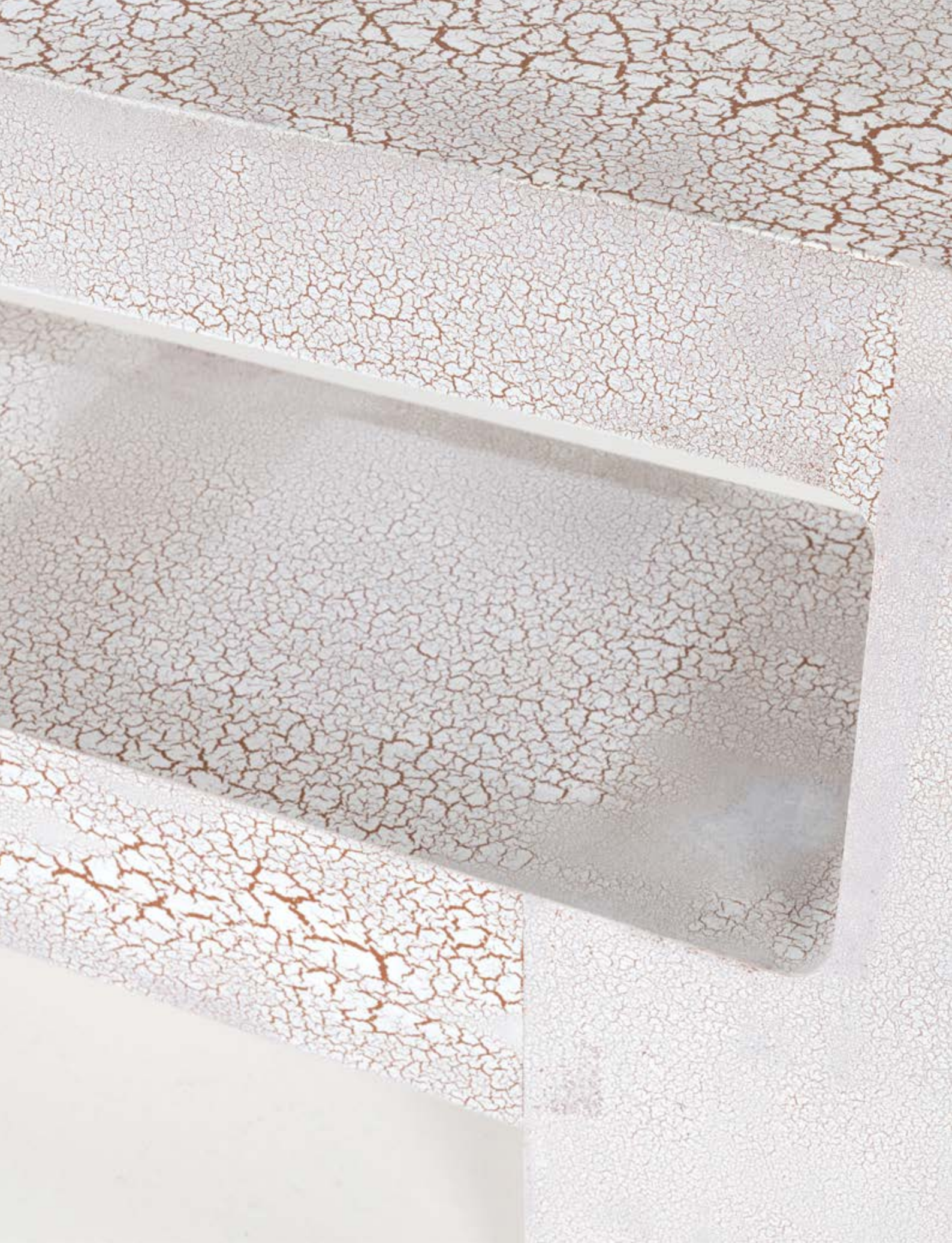
10. Charles Tassin (né en 1959) & Maylis Tassin (née en 1970) Console - Modèle 'Archh' Bois patiné Édition May Modèle créé en 2020 H 84 × L 195 × P 40 cm 10 000 / 15 000 €