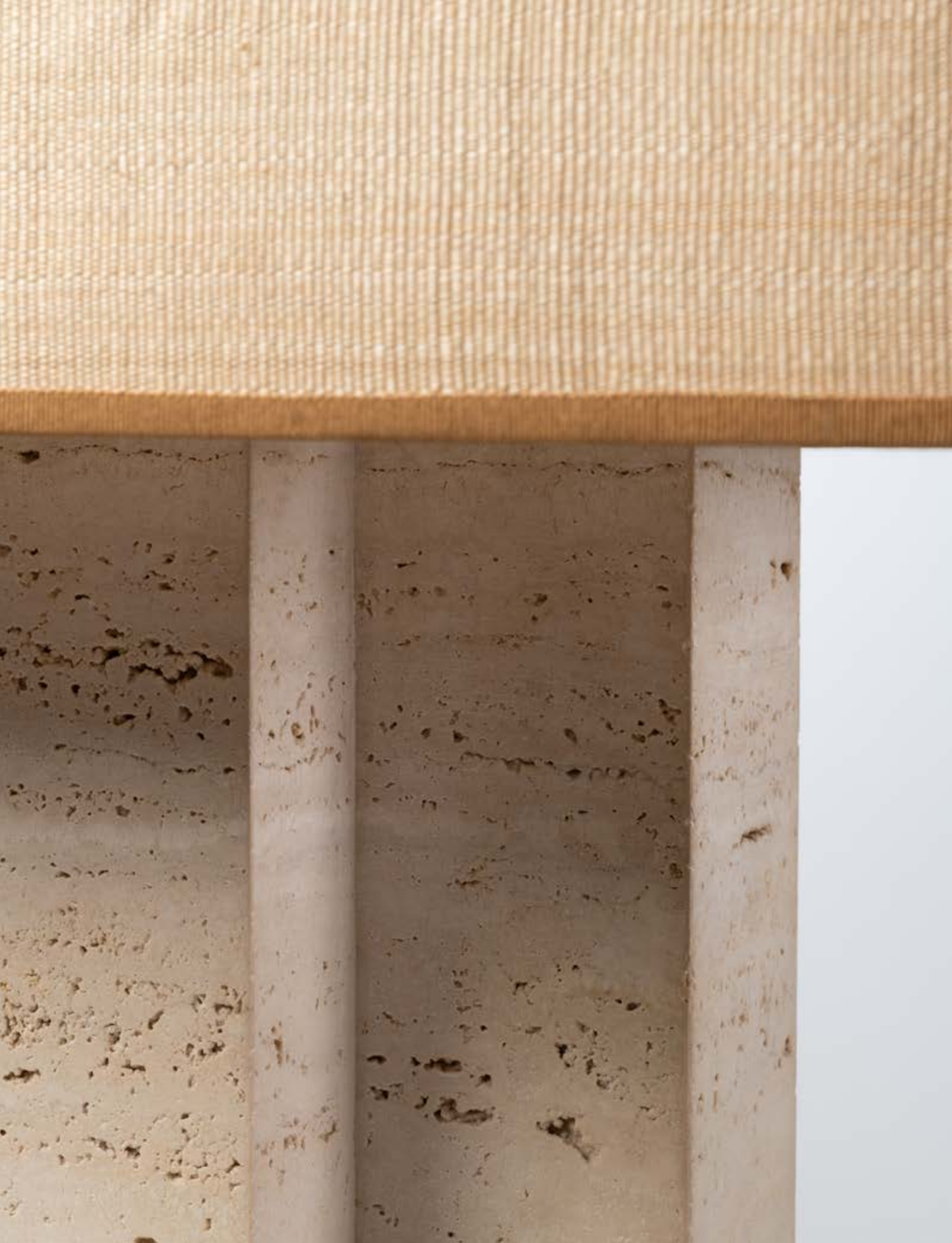
09. Charles Tassin (né en 1959) & Maylis Tassin (née en 1970) Lampe de table - Modèle 'Stonn' Travertin et lin Édition May Modèle créé en 2020 Hors abat-jour : H 58 × L 20 × P 13 cm Avec abat-jour : H 80 × L 50 × P 35,5 cm 1 000 / 1 500 €