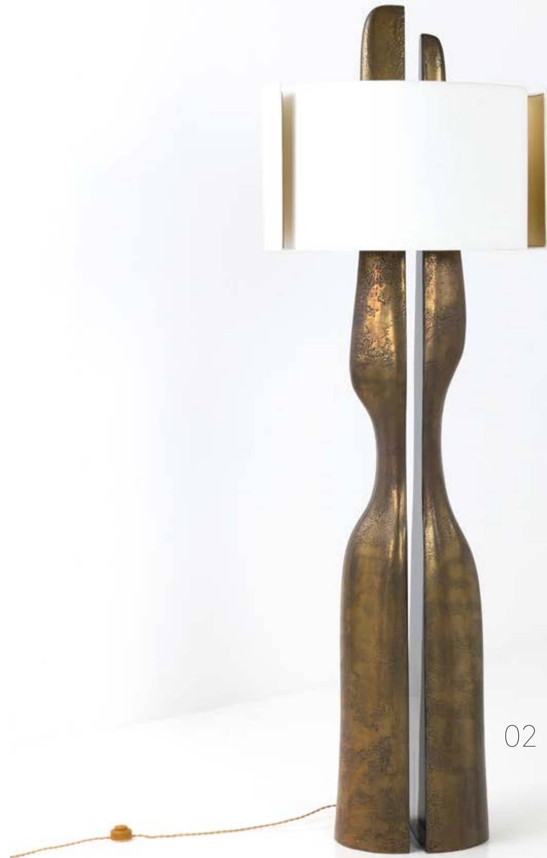
02. Charles Tassin (né en 1959) & Maylis Tassin (née en 1970) Lampadaire - Modèle 'Soff' Résine laquée et métallisée et textile Édition May Modèle créé en 2017 H 190 x L 67 x P 40 cm 5 000 / 7 000 €