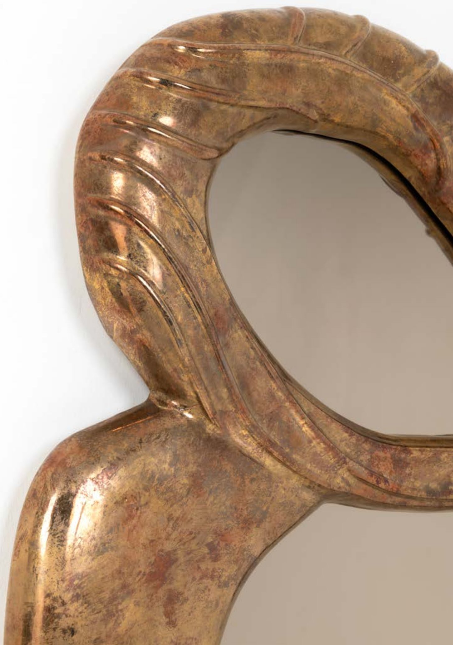
13. Charles Tassin (né en 1959) & Maylis Tassin (née en 1970) Miroir - Modèle 'Dorr' Céramique émaillée et miroir teinté Édition May Modèle créé en 2013 H 120 x L 78 x P 7 cm 5 000 / 7 000 €