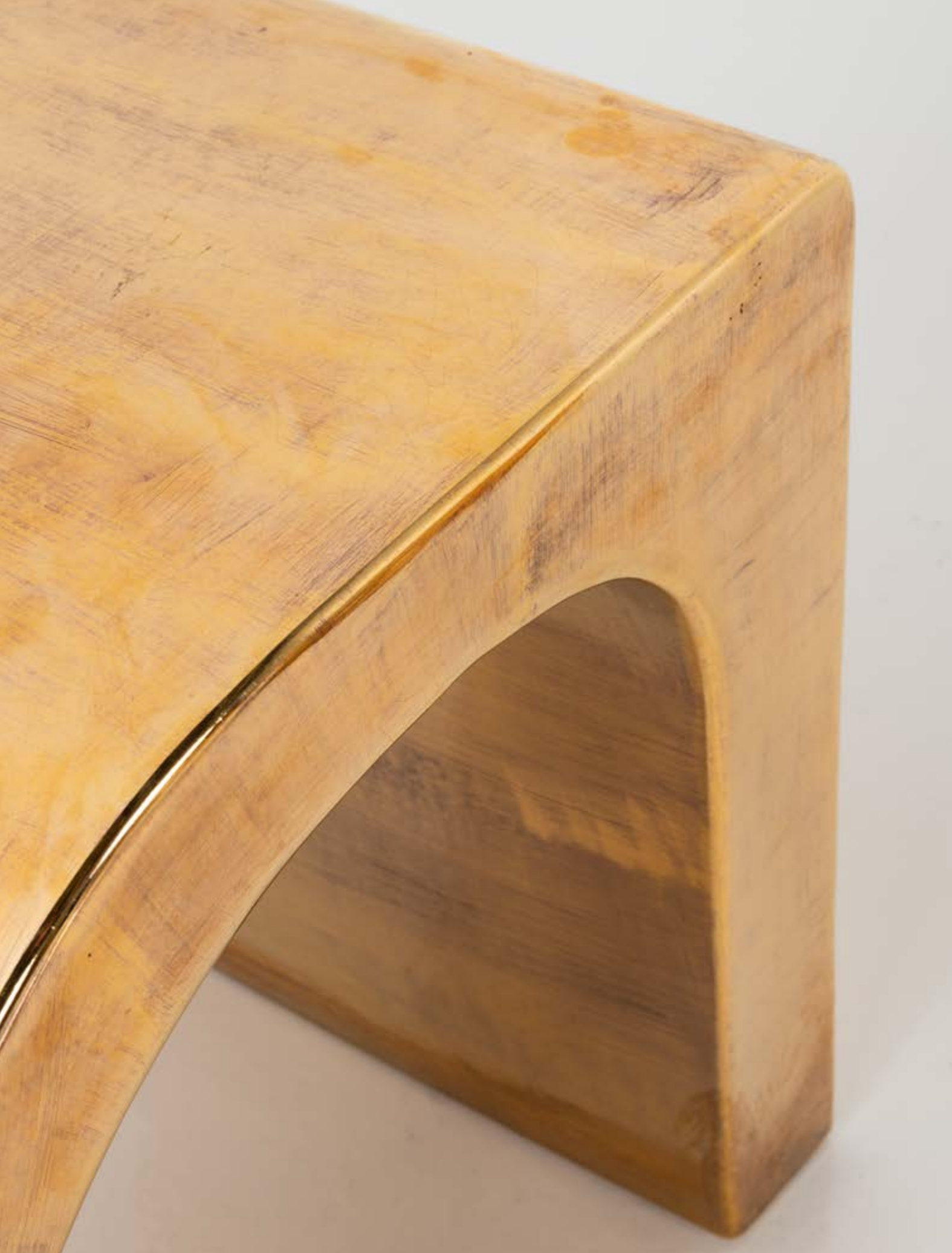
01. Charles Tassin (né en 1959) & Maylis Tassin (née en 1970) Paire de tables d'appoint - Modèle 'Elefann' Céramique émaillée Édition May Modèle créé en VERIF H 52×L 52×P 42 cm 3 000 / 6 000 €