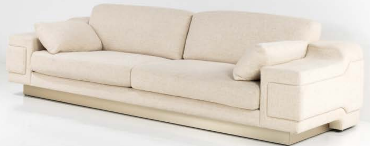
04. Charles Tassin (né en 1959) & Maylis Tassin (née en 1970) Canapé - Modèle 'Martt' Bois peint et textile Édition May Modèle créé vers 2017 H 85 × L 263 × P 117 cm 3 000 / 4 000 €