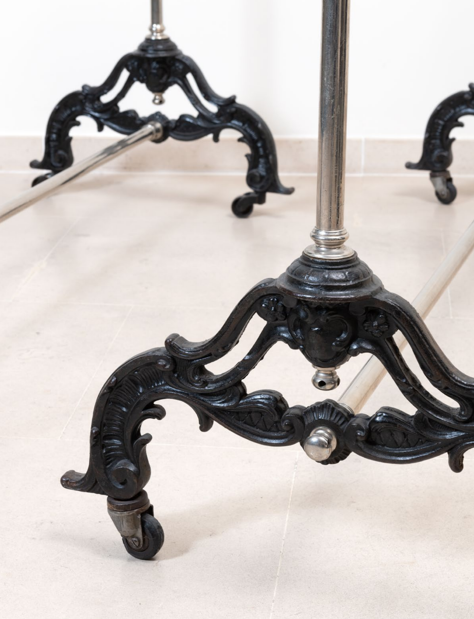
28. Travail du XXe siècle Deux portants à vêtements Métal noirci et chromé H 180 x L 150 x P 57 cm 200 / 300 €