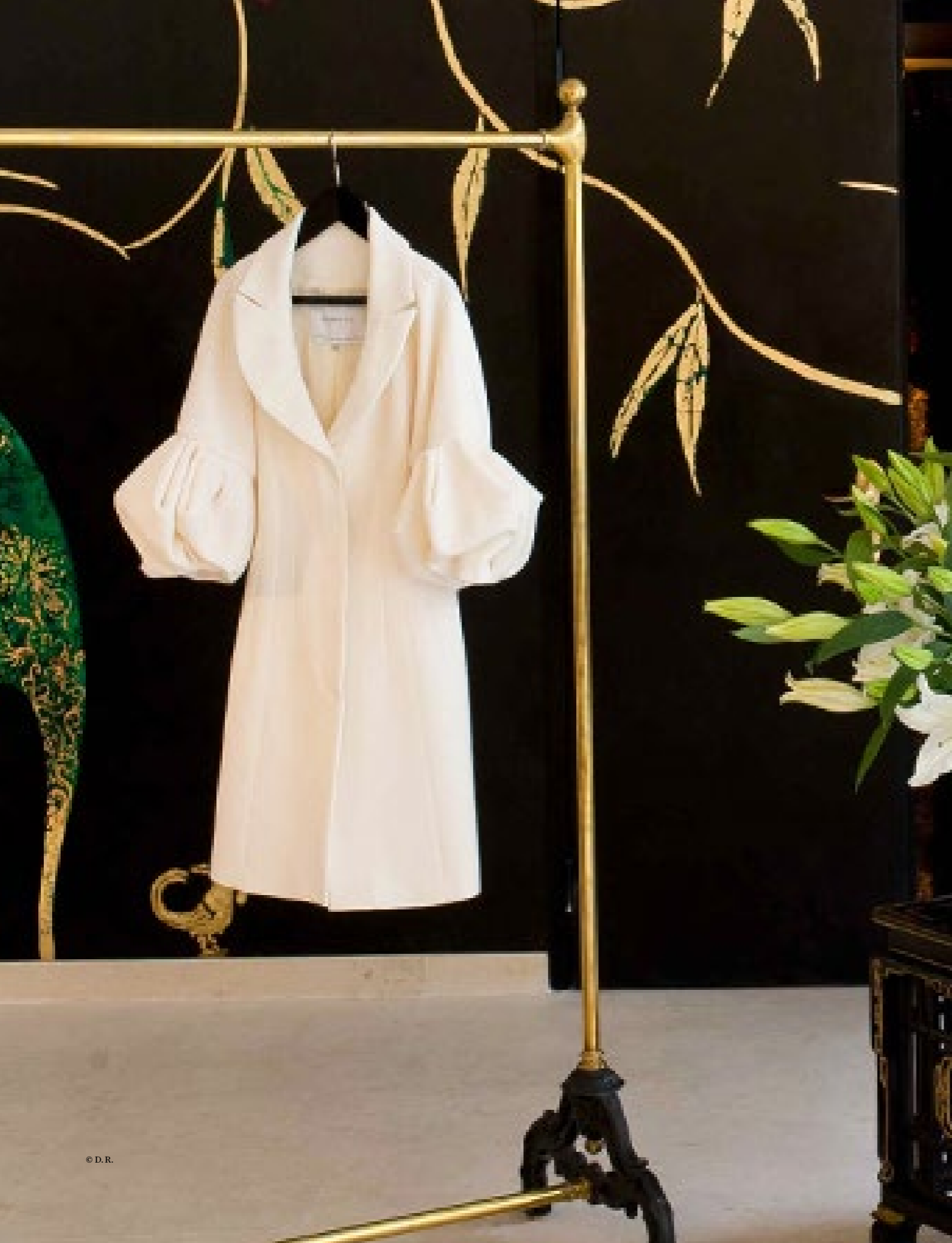
25. Travail du XXe siècle Deux portants à vêtements Métal noirci et laiton doré H 180 x L 150 x P 57 cm 200 / 300 €