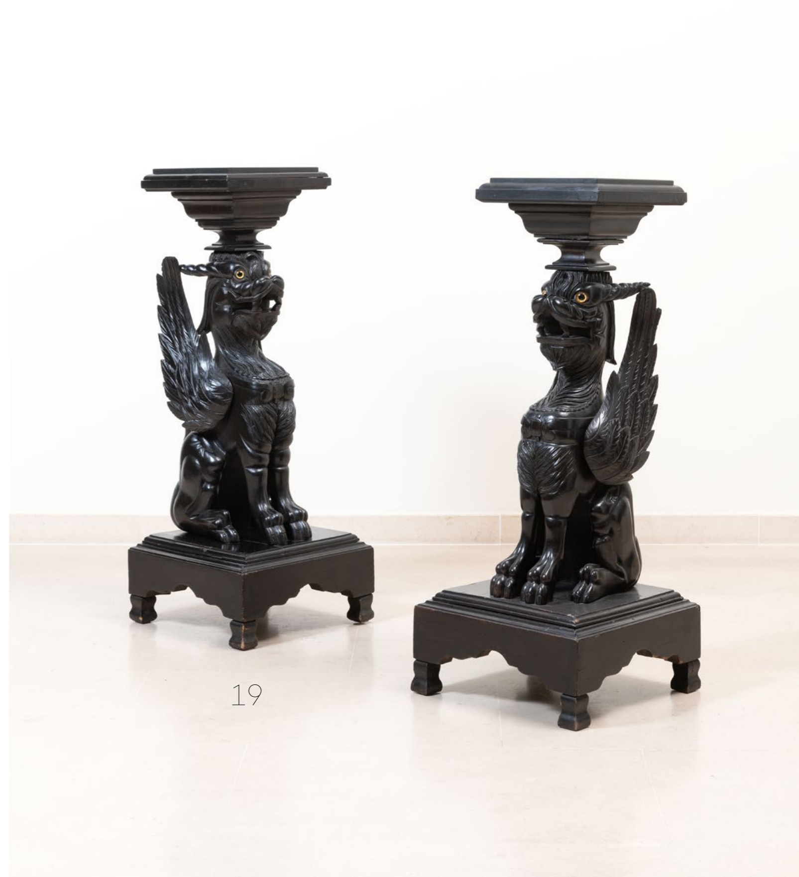
19. Paire de sellettes figurant des dragons ailés Bois teinté, granit noir et verre Travail extrême oriental de la fin du XIXe, début du XXe siècle H 103 x L 39 x P 39 cm 1200 / 1800 €