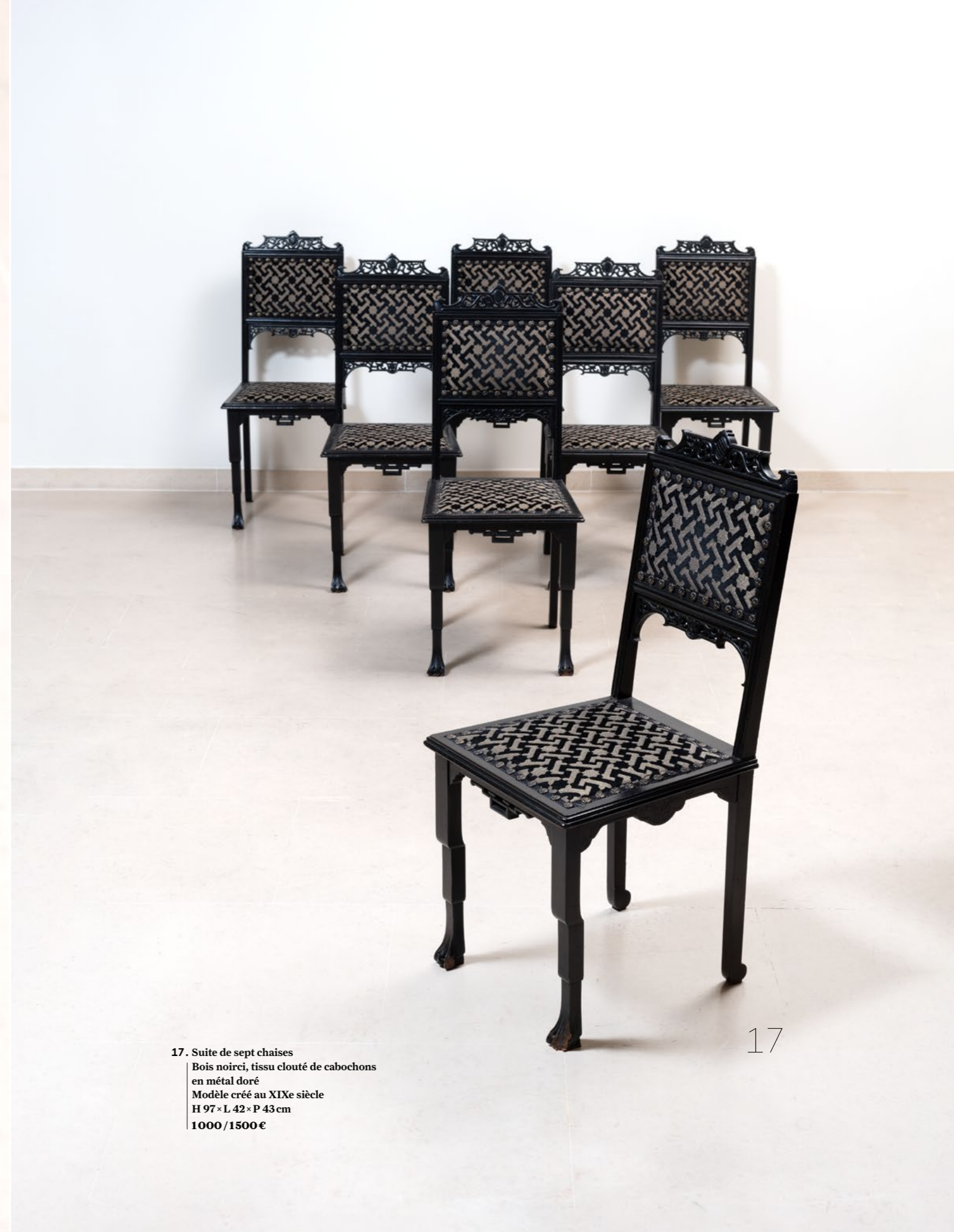
17. Suite de sept chaises Bois noirci, tissu clouté de cabochons en métal doré Modèle créé au XIXe siècle H 97 x L 42 x P 43 cm 1000 / 1500 €