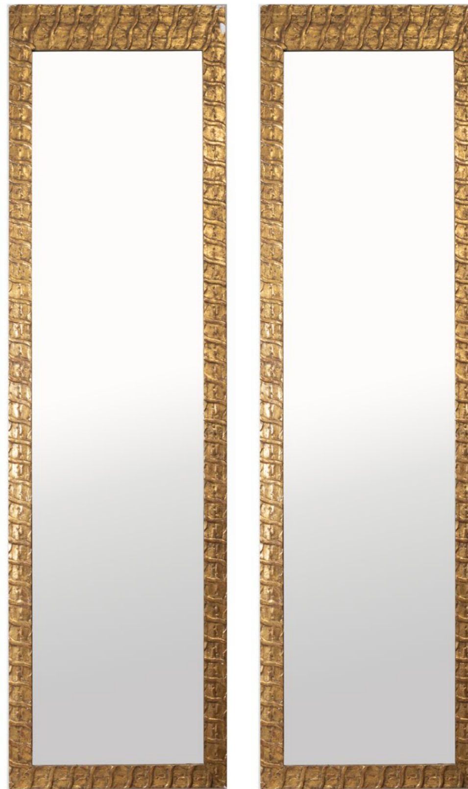
16. Paire de hauts miroirs Bois et stuc doré Modèle créé au XXe siècle H 310 x L 85 cm 1500/2000 €