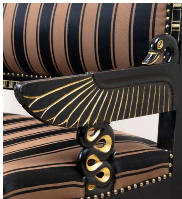
07. Banquette Bois laqué, doré et tissu à décor 'Egyptomania' Modèle créé au XXe siècle H 95 x L 140 x P 60 cm 1500 / 2000 €