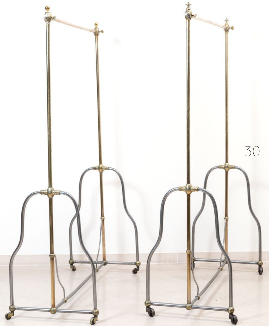
30. Travail du XXe siècle Deux grands portants à vêtements Métal tubulaire chromé et doré H 188 x L 138 x P 52 cm 200 / 300 €