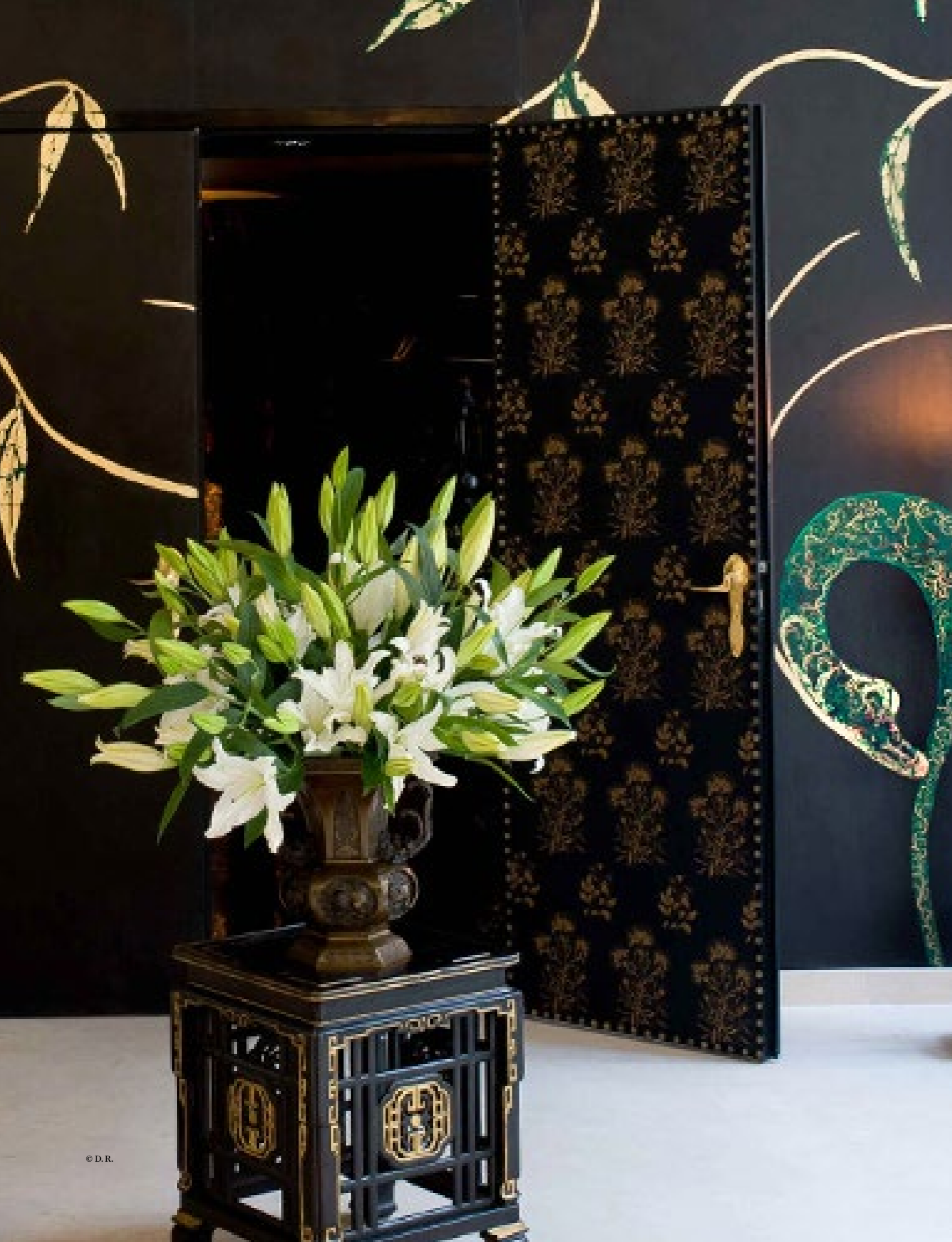
23. Paire de bouts de canapé à motifs ajourés Bois teinté noir et or Modèle créé au XXe siècle H 53 x P 43 cm 600 / 900 €