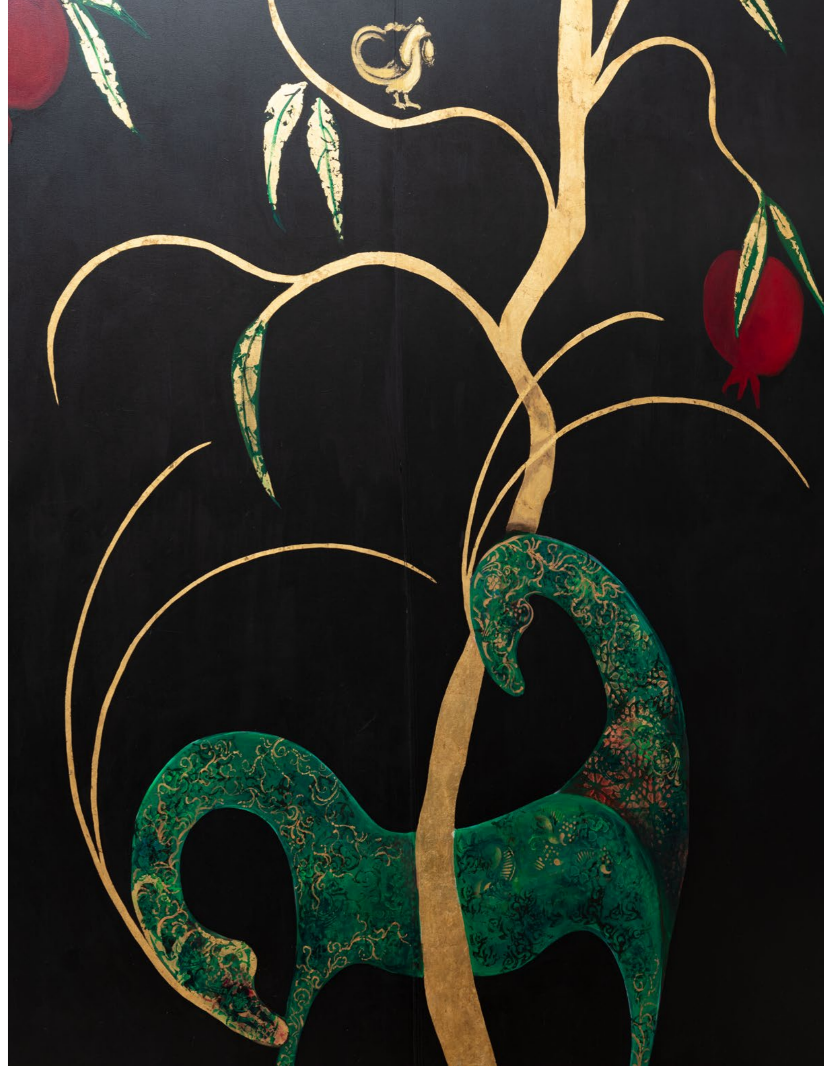
04. Roshanak Varasteh (née en 1965) Garden of Eden Fresque murale peinte sur toile composée de six lés Pièce unique Signée et datée Commande particulière pour le Salon Andrew GN Réalisée en 2010 Dimensions totales : L 640 x H 405 cm Chaque lés : H 402 x L 125 cm Vendu sur désignation 2000/3000 €