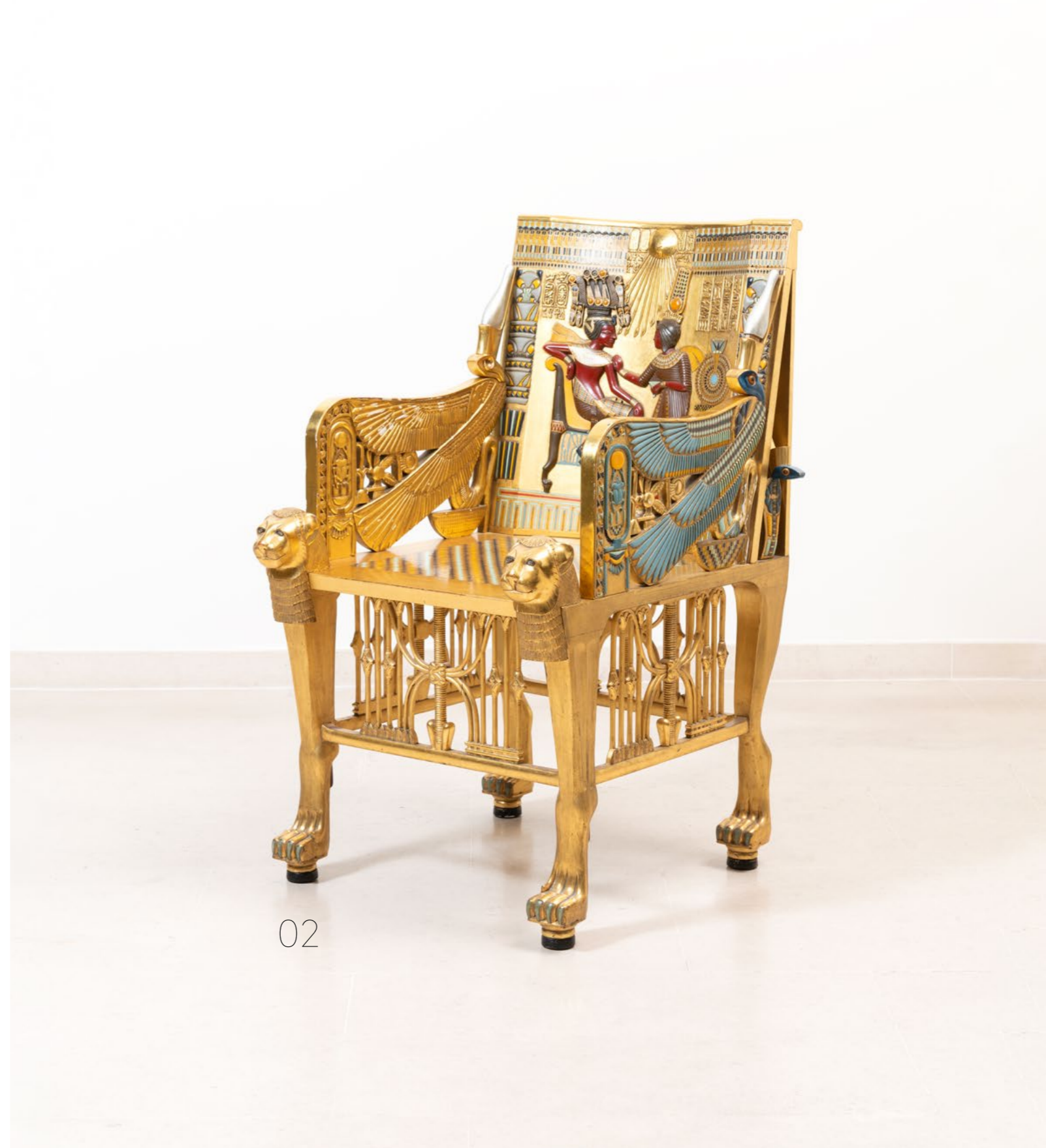
02. Trône de Toutankhamon, d'après Milieu du XXe siècle Bois doré et polychrome à décor sculpté en haut relief H 102 x L 60 x P 67 cm Provenance : Dorotheum, Vienne, 29 Octobre 2018 Note : Réplique du modèle original conservé au Caire 3000 / 4000 €