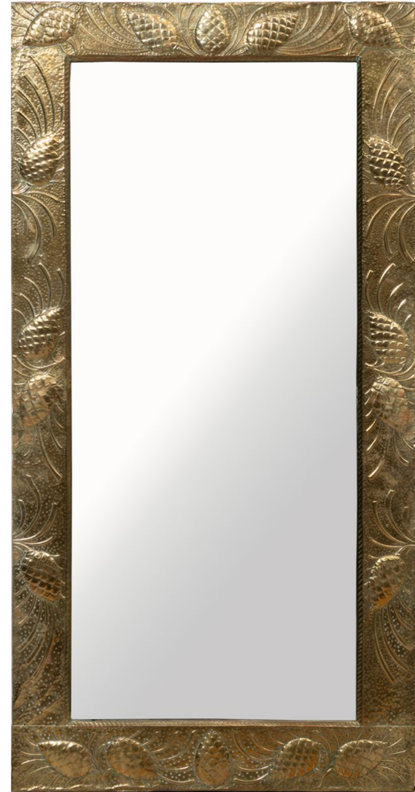
06. Miroir Bois et laiton repoussé à décor de grappes Modèle créé au début du XXe siècle H 130 x L 66 cm 400 / 600 €