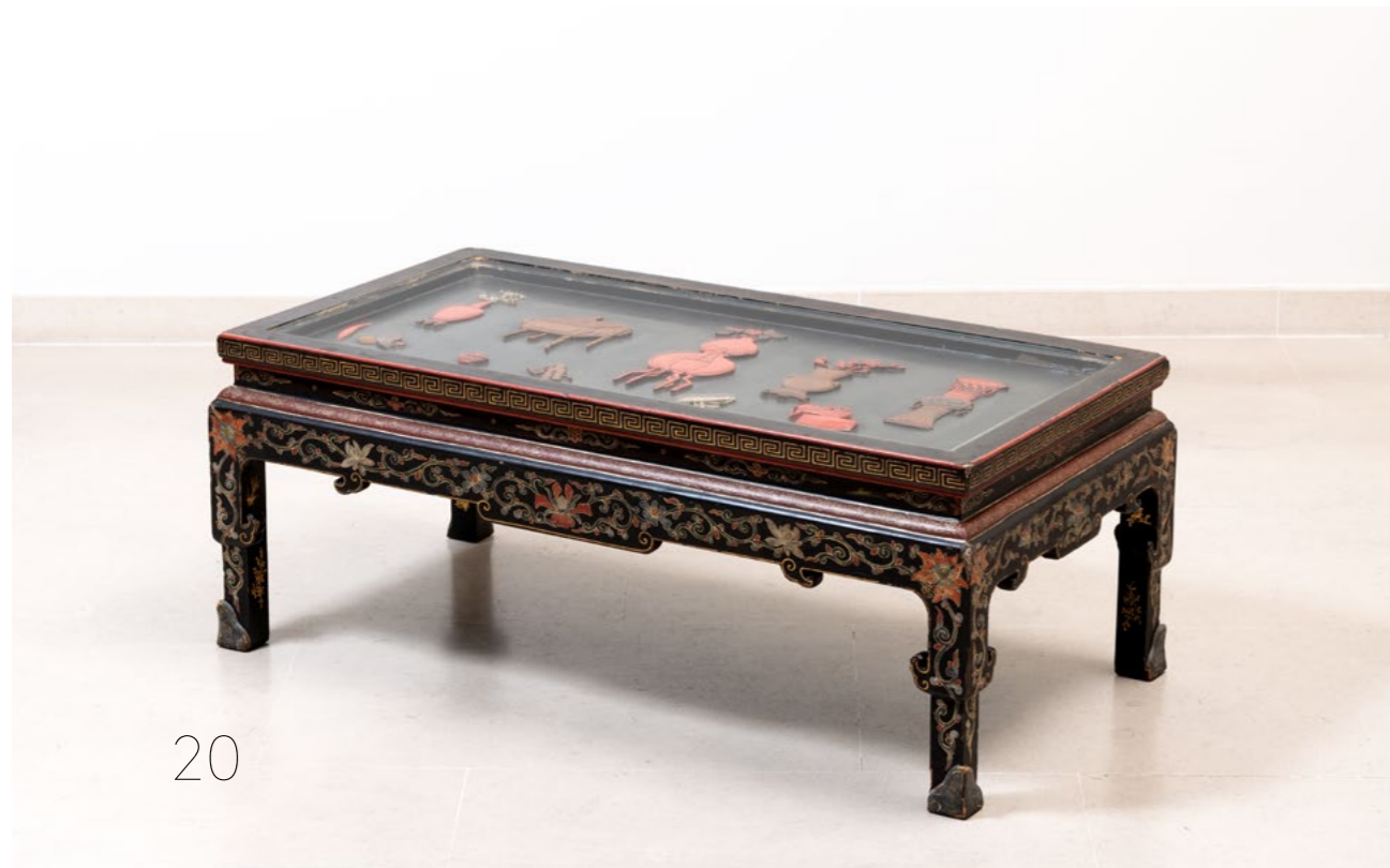
20. Table basse Âme en bois teinté à décor en semi-relief d'instruments polychrome, plateau en verre Chine XXe siècle H 41 x L 107 x P 55 cm 400 / 600 €