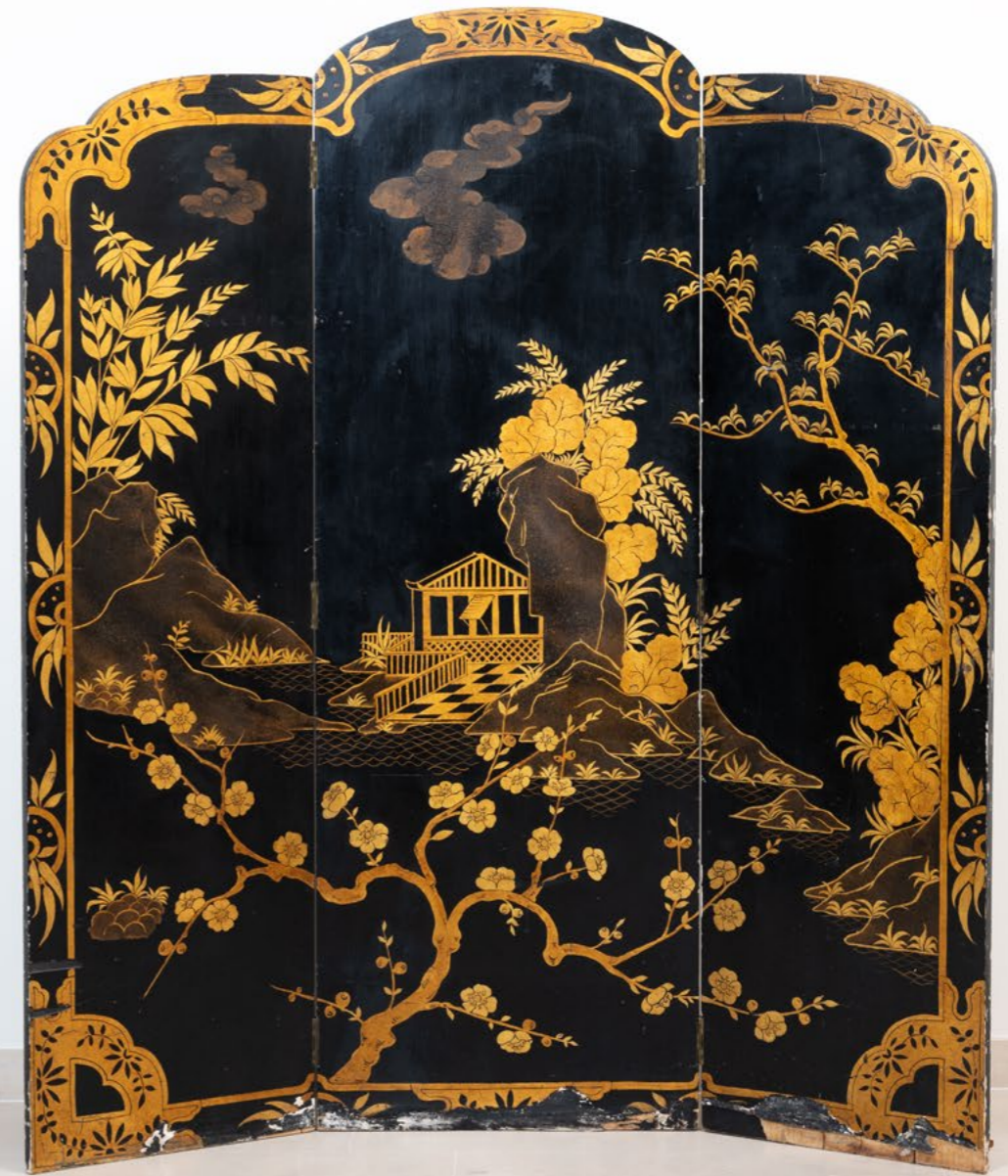
22. Paravent à trois vantaux Bois laqué noir, doré et Hiramaki-e Travail anglais du XIXe siècle H 170 x L 152 x P 3 cm (ouvert) H 170 x L 58 x P 3 cm (fermé) 300 / 400 €