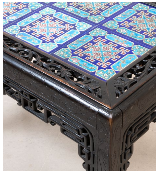
18. Table Bois teinté et plateau de carreaux en céramiques de Longwy Ceinture du plateau ajourée Modèle créé à la fin du XIXe siècle H 75 x L 102 x P 62 cm 600 / 900 €