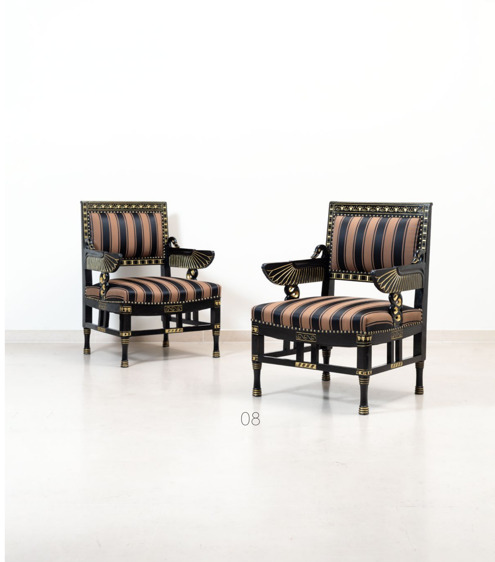
08. Deux fauteuils Bois laqué, doré et tissu à décor 'Egyptomania' Modèle créé au XXe siècle H 93 x L 64 x P 60 cm 1500 / 2000 €