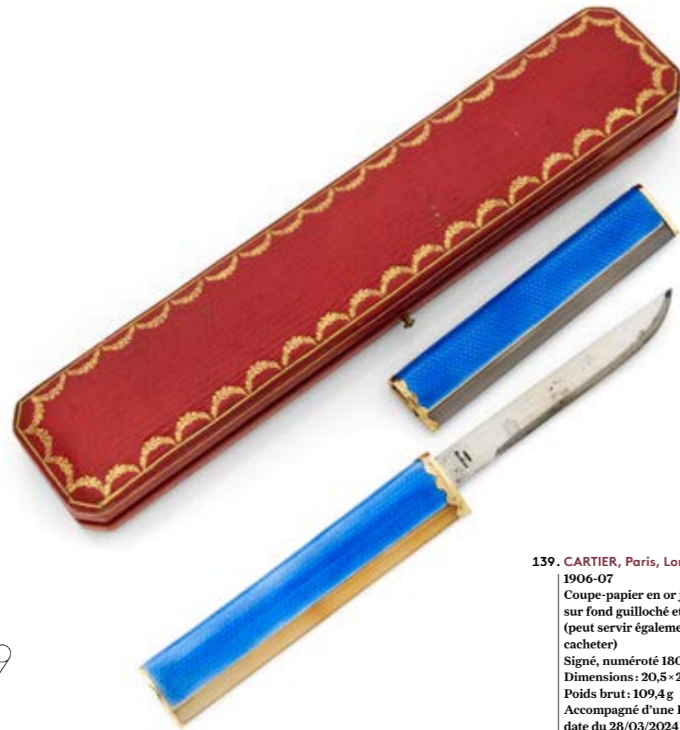
139. CARTIER, Paris, Londres 1906-07 Coupe-papier en or jaune 18 k (750‰), émail sur fond guilloché et agate, lame en acier (peut servir également de grattoir pour cire à cacheter) Signé, numéroté 1800, poinçon de titre Dimensions : 20,5×2,1 cm Poids brut : 109,4 g Accompagné d'une Expertise d'Alain Cartier en date du 28/03/2024 Écrin signé 3500 / 4500 €