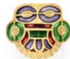
26. Original collier en or jaune 18 k (750 ‰) retenant au centre 19 charms en pampille dont certains émaillés à décor d'étoiles et d'animaux, tour de cou double chaîne à maillons jaseron Longueur: 40 cm Poids brut: 38,7 g 2000 / 4000 €