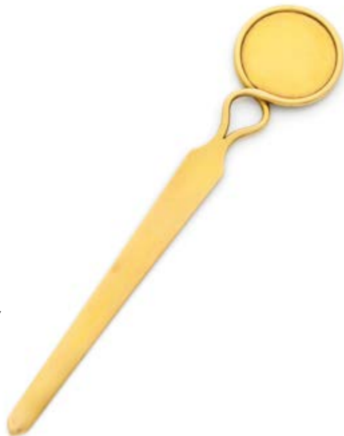
97. Marque-pages en or jaune 18 k (750‰) satiné Dimensions : 13,2×2,7 cm Poids : 16,2 g 500 / 800 €