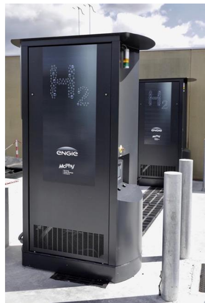
Station bus avec production d'hydrogène : technologies McPhy