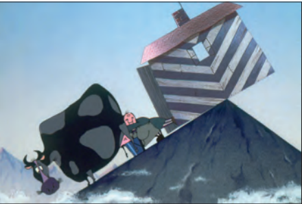
Au bout du monde 1999