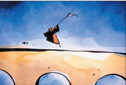
Le Moine et le poisson 1994