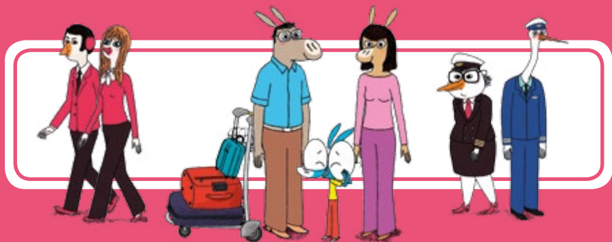
Illustration affiche : Marc Boutavant. Mise en page : Pauline Tortosa.

(photos, dossier de presse, bande annonce, livret pédagogique...)